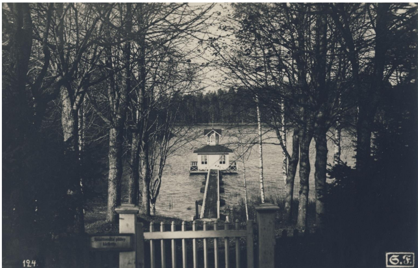
Syvärannan tilan laituri 1920 -luvulla.

Tämä toimintakertomus ja tilinpäätös on säilytettävä 31.12.2026 saakka