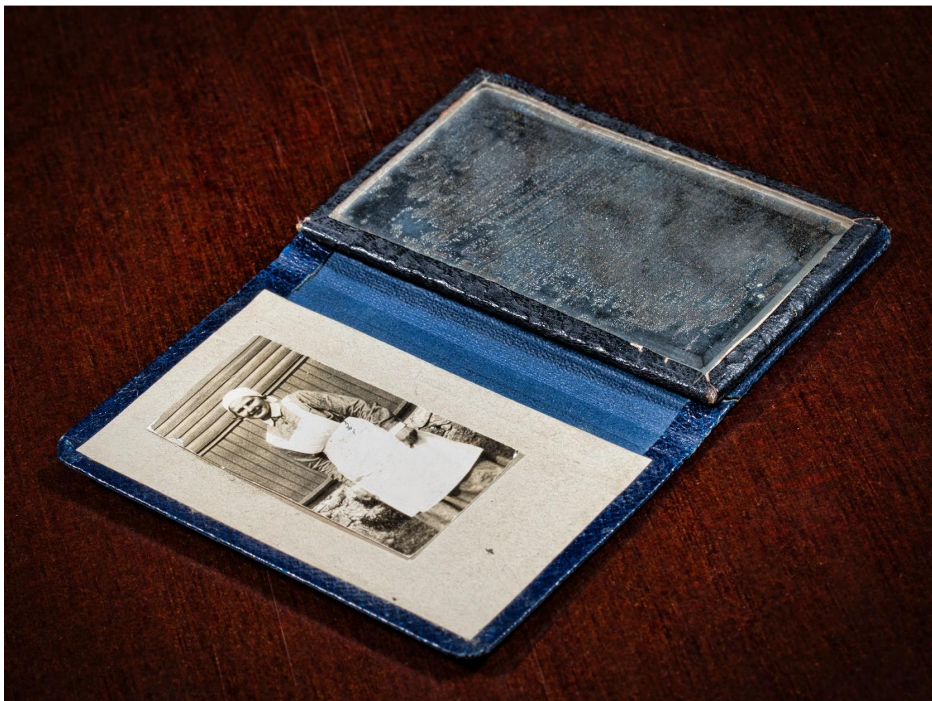
Lotta Svärd -järjestön jäsenkortti

Tämä toimintakertomus ja tilinpäätös on säilytettävä 31.12.2029 saakka